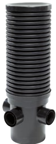
Salaojan tarkastuskaivo yhteillä