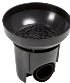
MX-Rännikaivo SVK 300/100-110 mm