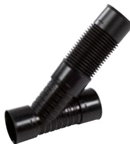
Taipuisa muhvikulma ja -haara SN8