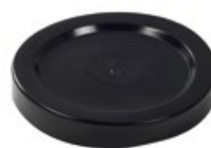
Umpikannet PE ja RST