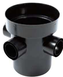
Tarkastuskaivon pohjaelementti yhteillä